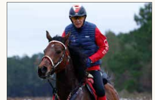
Cheval d'exception - le trophée Hickstead MORE BANG FOR YOUR BUCK