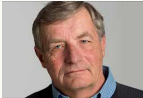
Prix pour l'ensemble des réalisations CRAIG COLLINS