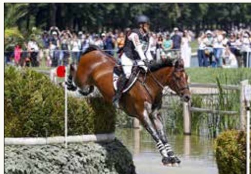
Cheval d'origine canadienne de l'année FREEDOM GS (HUMBLE GS X FRIEDEL GS) Propriétaire : Charlotte Schickedanz Élevage : Charlotte Schickedanz